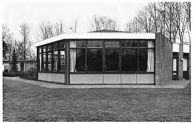
Centrale punt van het sportpark 'De Boskamp' is de fraai gebouwde kantine.