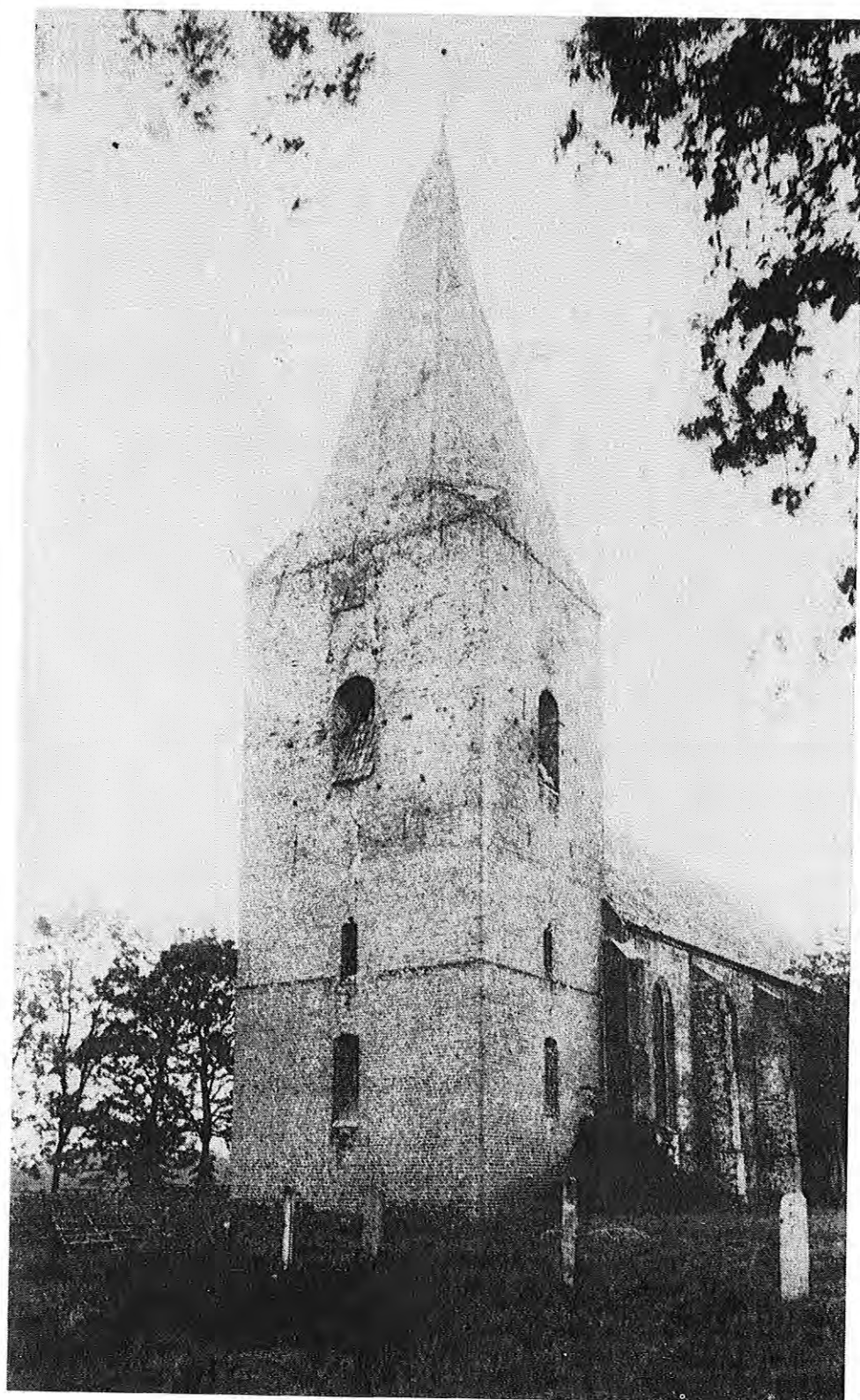
Ned. Herv. Kerk te Onstwedde vóór de restauratie van de toren in 1895