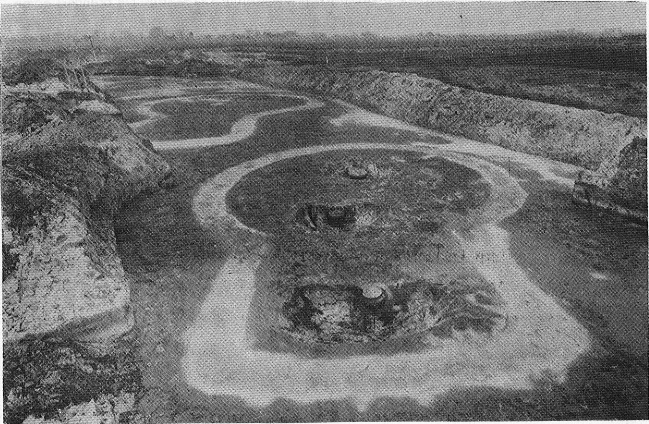
Sleutelgatvormige kringgreppels bij de opgravingen te Wessinghuizen in 1927.