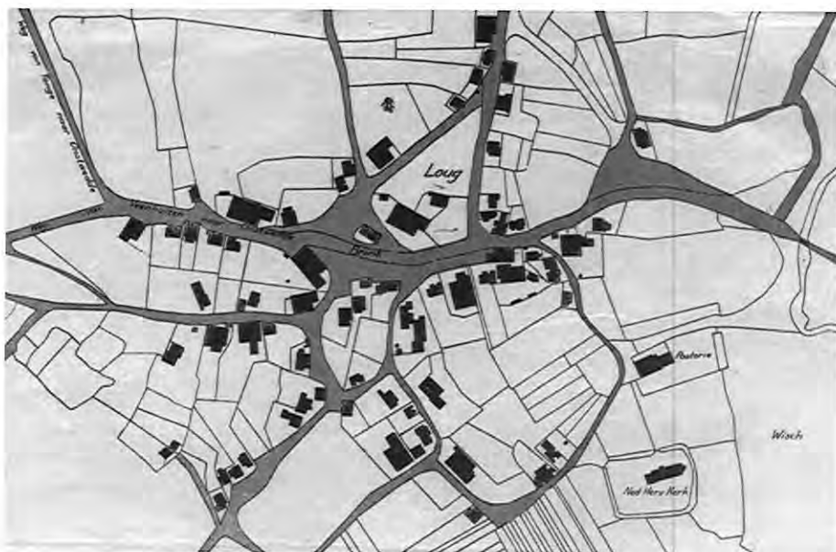
Plm, 1830. Plattegrond van de naaste omgeving van de school.